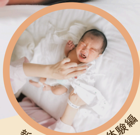
新生児のお世話 体験編