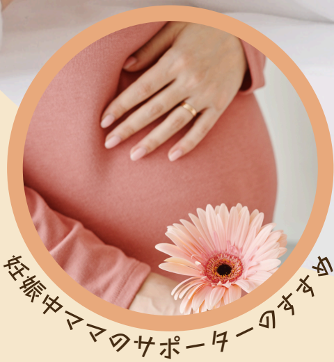
妊娠中ママのサポーターのすすめ

小さな命を迎えてこれから子育て・孫育てを スタートさせる新米パパ、ばあば、じいじへ。