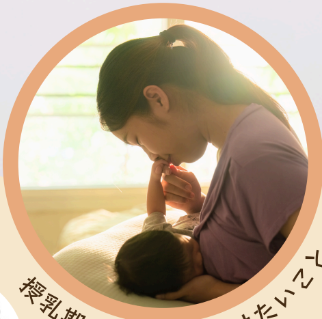
授乳期に家族が心がけたいこと